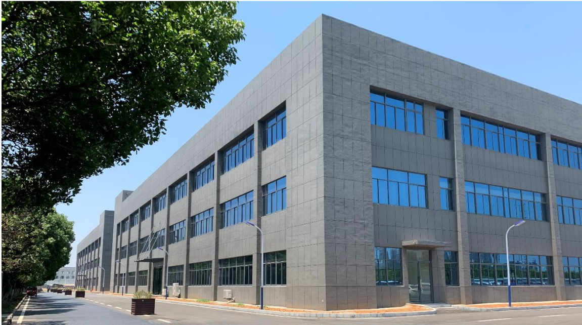
公司“年产 10 亿只超小型、高精度 SMD 石英晶体谐振器项目”生产厂房实景照片

报告期内，公司募投项目“年产 10 亿只超小型、高精度 SMD 石英晶体谐振器项目”生产厂房建设完工，部分生产设备开始安装调试工作，报告期末已建成部分产能；公司募投项目“研发中心建设项目”已完成研发中心大楼的规划与设计工作，并开始基建工作和采购部分研发设备。